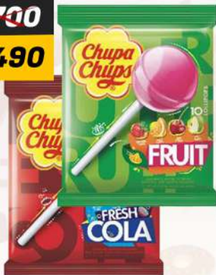
CHUPA CHUPS BAG ASSTD/PKT تشوبا تشوبس