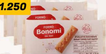
BONOMI PUFF PASTRY 3X135GM بونومي باف باستري