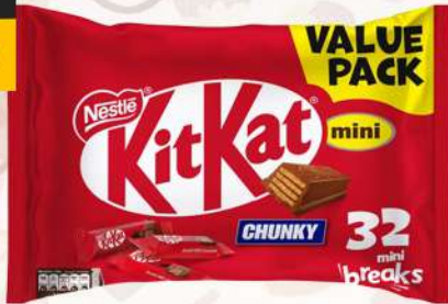
KITKAT CHUNKY MINI 500GM كيت كات تشنكي ميني