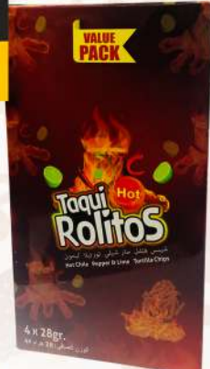
TAQUI HOT CHIPS 4X28GM تقي-رقائق ساخنة