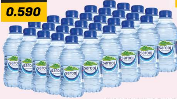
SAROJ WATER 30X250ML ماء الصاروج