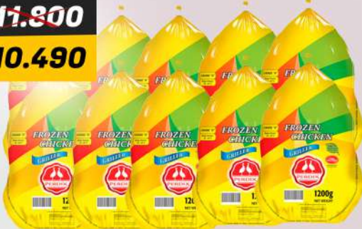
PERDIX BRAZIL CHICKEN 10X1200GM برديكس دجاج برازيلي