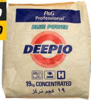
DEEPIO 19KG ديبيو