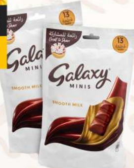
GALAXY MINIS 2X162.5GM جالاكسي مينيس