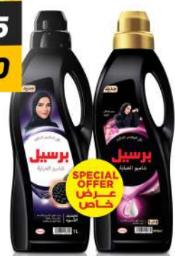
PERSIL BLACK 1L CLASSIC +900ML ROSE برسيل