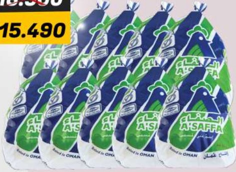
ASAFFA CHICKEN 10X1300GM دجاج الصفا