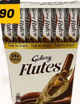
GALAXY FLUTES 270G جالاكسي فلوتس