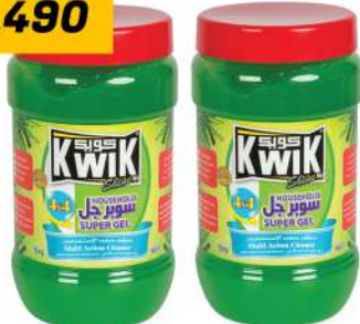
KWIK SHINE SUPER GEL 2X1KG كويك شاييت سوبر جل