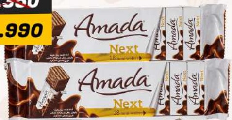
AMADA NEXT WAFERS 2X117GM أمادا نكست وافرز