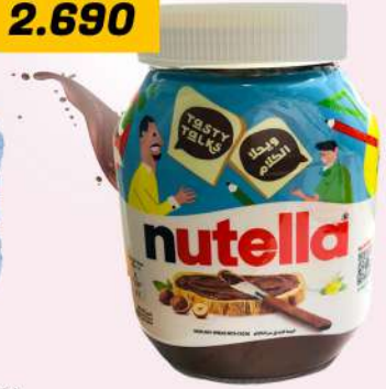
NUTELLA 825 GM نوتلا