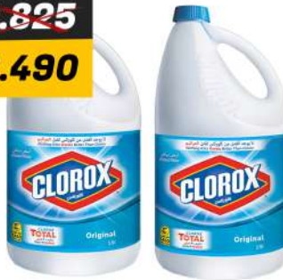
CLOROX BLEACH GALLON 2PCS كلوروكس