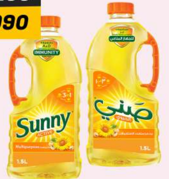
SUNNY COOKING OIL 2X1.5L زيت صني للطبخ