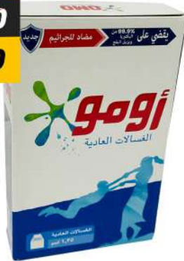
OMO DETERGENT POWDER 1.25KG مسحوق تنظيف أومو