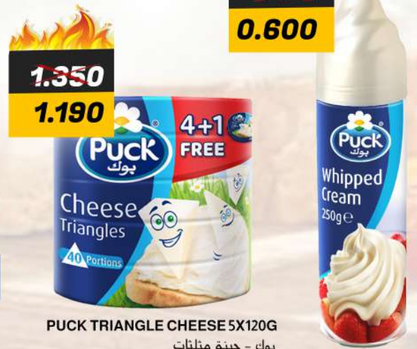
WHIPPING CREAM 250G كريمة خفقا