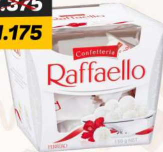
RAFFAELLO 150G رافاييلو