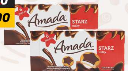
AMADA STARZ MILKY 2X6X37.5GM أمادا ستارز ميلكي