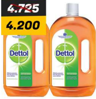
DETTOL LIQUID 2X1LTR ديتول سانك