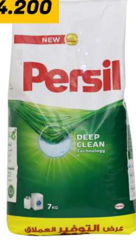
PERSIL DETERGENT POWDER 7KG مسحوق غسيل برسيل