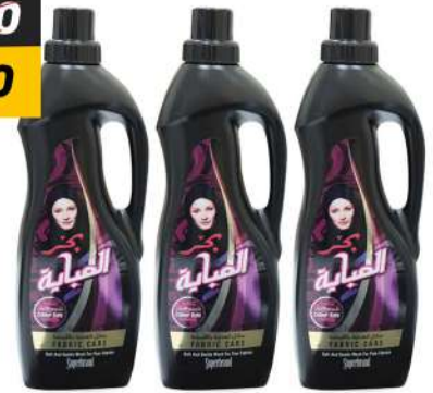
BAHAR ABAYA 3X1LTR بهار عبايا