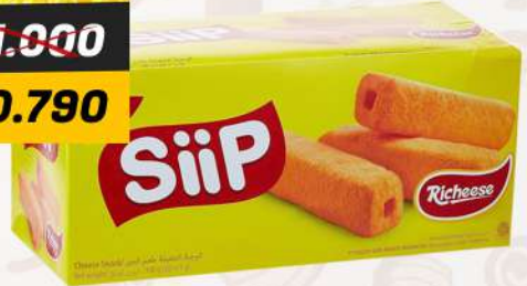
NABATI SIIP CHEESE SNACK النبطي