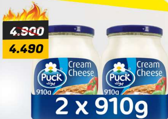
PUCK CHEESE JAR 2X910G بوك - جرة جبنة