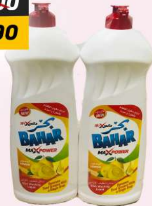
BAHAR MAX POWER DWL 2X600ML بجر ماكس باور