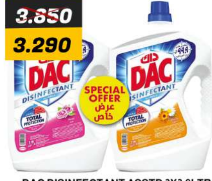
DAC DISINFECTANT ASSTD 2X2.9LTR مطهر داك